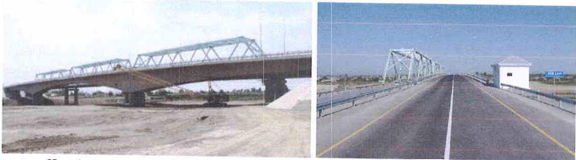
Ադրբեջան, Hajigabul-Bahramtepe ճանապարհի վերահսկողություն, Կուտ գետի կամուրջ

Ավելին, Ադրբեջանում Այ. Ար. Դի. Էնջինիբրինգը 2016 թ-ին սկսել է Բաքու-Շամախի-Մուգանլի ճանապարհի շինարարական աշխատանքների վերահսկողությունը , ծրագիրը երթադրում է 30 կմ ճանապարհահատվածի բարելավման աշխատանքներ՝ FIDIC պայմանագրի պայմանների համաձայն: Իսկ նախորդ տարիներին Այ. Ար. Դի. Էնջինիբրինգը իրականացրել է Hajigabul-Bahramtepe ճանապարհահատվածի, Խմբ. 1, Խմբ. 2 և Կուտ գետի կամրջի և միացնող ճանապարհների վերահսկողություն ՝ FIDIC պայմանների համաձայն, ՄԶԲ ֆինանսավորմամբ: